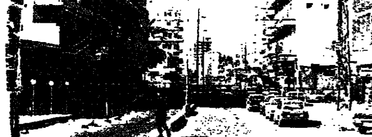
شوارع صيدا .. حركة خفيفة

اصابت المطرانية المارونية ونجاة الطران حلوا باعجوبة اقتلى ٦ وجرح ٤ واجرحا في صيدا